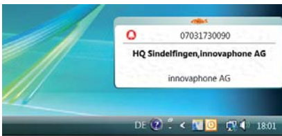
innovaphone Operator: wanneer een gesprek binnenkomt, opent automatisch een nieuw venster

De innovaphone Operator is een Windows .NET applicatie en loopt op Windows XP, Windows Vista en Windows7.