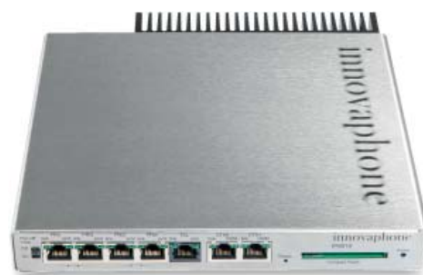
Brama VoIP innovaphone IP6010