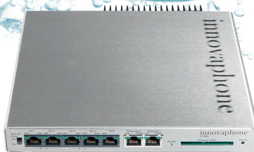
innovaphone VoIP Gateway IP800

Al momento della configurazione della soluzione di innovaphone presso secion, doveva essere superata una particolare sfida: lo specialista di sicurezza IT necessita sul suo sistema ed esclusivamente per un cliente di un secondo numero di telefono totalmente diverso. „Grazie alla flessibilità dell'innovaphone PBX, questo non ha rappre-