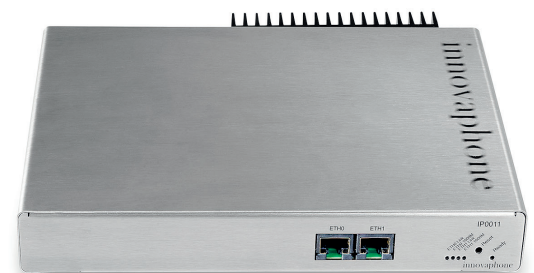
innovaphone VoIP Gateway IP0011