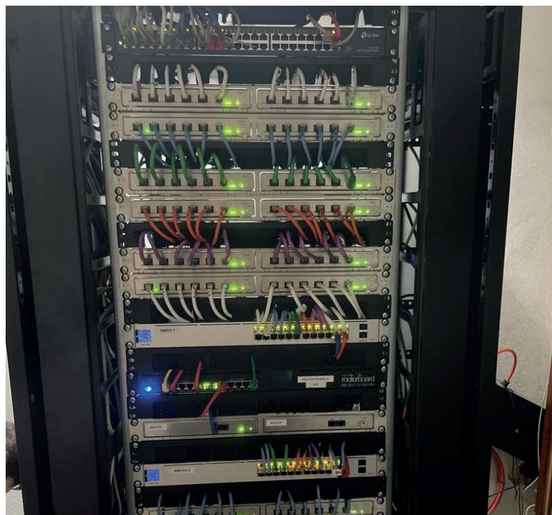
Installation innovaphone actuelle

employés des différents services - commercial, administration, clientèle, etc. - peuvent communiquer avec des utilisateurs internes ou avec des clients externes à l'hôtel. Le système lui-même permet également de configurer des salles de conférences virtuelles audio et vidéo, internes ou externes via internet, pour organiser des réunions avec des collègues, des clients, des fournisseurs, etc.