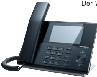
IP232 - Ausgefeilte Technik und ausgezeichnetes Design

Der Wizard ermöglicht ein kinderleichtes Installieren der Software, ein Rollout-Tool unterstützt die Installation der Endgeräte und der integrierte Update-Server verwaltet zentral alle Updates für Gerätegruppen im Netz.