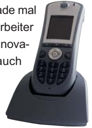
WiFi-Telefon innovaphone IP62

derzeit erreichbar, auch wenn sie gerade mal nicht am Platz sind. Damit Ihre Mitarbeiter mobil bleiben, werden auf Basis der innovaphone PBX selbstverständlich auch schnurlose Endgeräte angeboten.