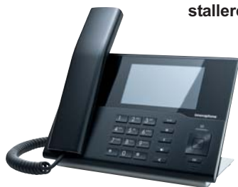
IP232- Verfijnde techniek en bekroond design