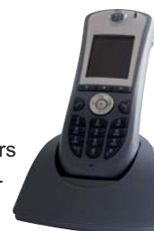
Wifi-telefoon innovaphone IP62